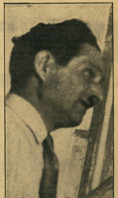
אישי-משען בורשטיין לא טרח לאסוף הוכחות

המשיך חבר אחר של הועדה להטיף מוסר: "דבר אחד שלא תעזו לעשות: אל תנסה לפרסם את הפרשה בעתונות, עד לסיום החקירה. אם בכל זאת לא תשמע