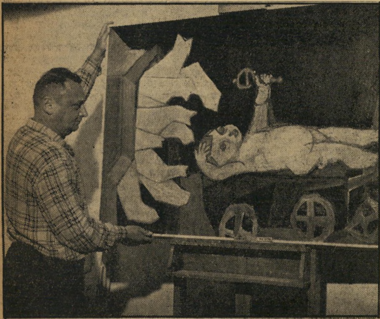
צייר גת ויצירה התרבות

יתרה זאת השתלשלות מאלפת, אך לא חשובה. כי השאלה היסודית לא היתה אם ישתתפו בתערוכה פאריס שבעה או 32.