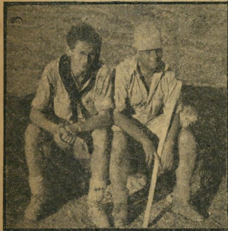
המפקד עם אחד מפיקודיו, בעת טיול בי דרום, לפני קום המדינה. שפאק עבד בעיריית תל-אביב, הקדיש להגנה את שאר זמנו.