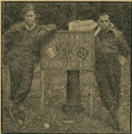
איש הבריגדה ליד שלט באיטליה, המראה את הדרך למחנה הפלוגה המסייעת, בה שרת שפאק כסמל.