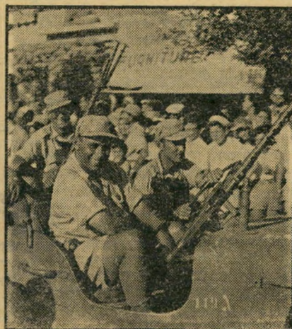
השועל בנייף המפקד של שועלי שמשון, במיצעד 1948 ברחובות. בתום המיצעד לחץ ביגיי את ידי שפאק.