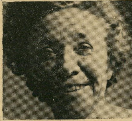
גב' הילדה ג.