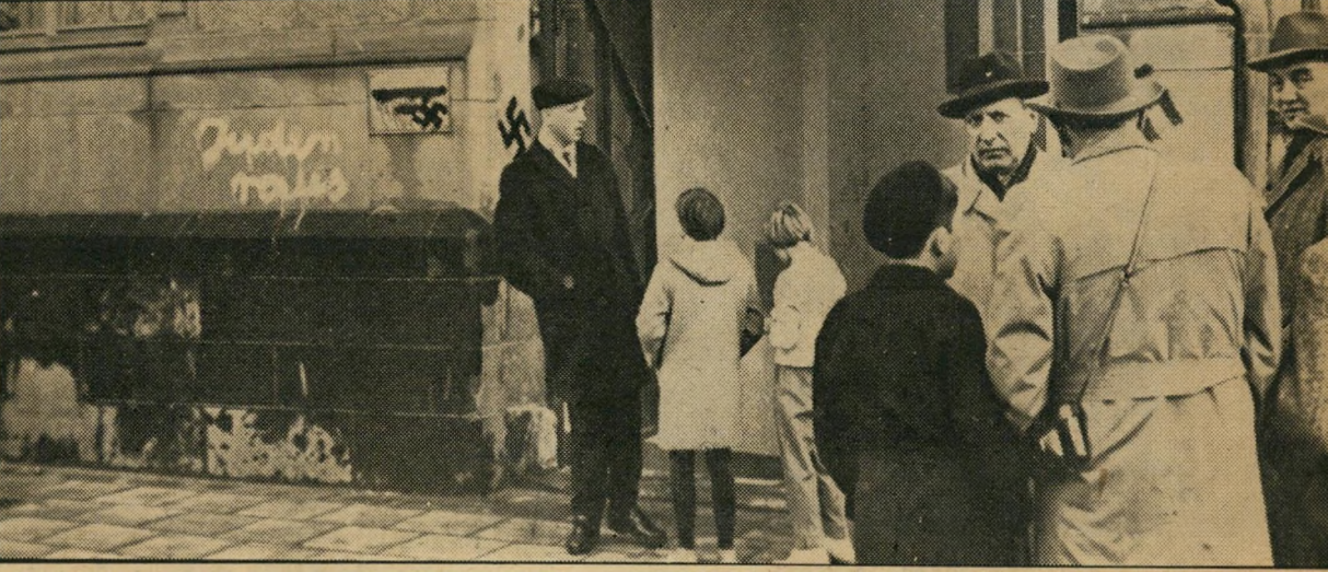
בית־הכנסת בקלן: אזרחי־העיר לפני הסיסמה „יהודים החוצה!“

אולם עצם היותו מרוחק מן העבר הקרוב, הופך את הנוער הזה חזיר להשפעות ניאור־נאציות. מכיון שאינו יודע מאומה על אדולף היטלר, אפשר לצייר לו את היטלר כגיבור