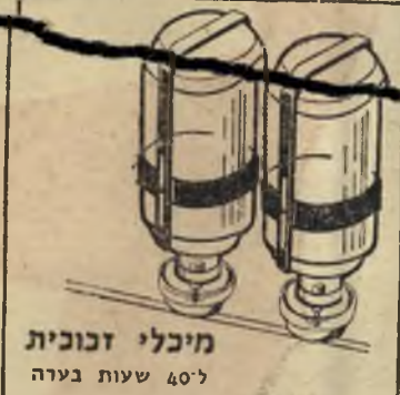
מיכלי זכוכית 40" שעות בערה

המנוע... בומן האחרון קראנו בעתונות פרסימים וגלויי דעת תפלים של חברות שונות לייצור תנורים דומים ל"פיירפרפקט". חברות אלו מנסות