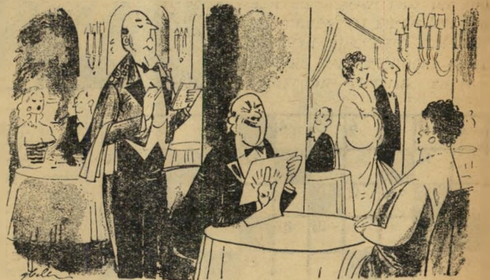
"מה דעתך שנתחיל עם קוויאר?"