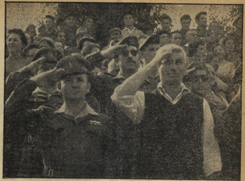
צ'נדלר ורון במיפקד ההורים כוכב במרחק שלושה מטרים