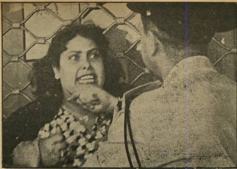
— פנים אל פנים —