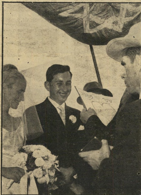
חופה בוער הקהילה בת"א