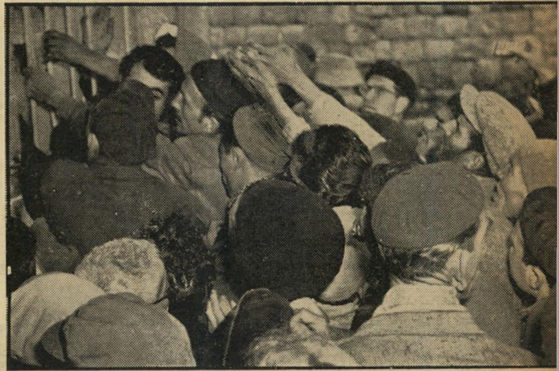
מובטלים ליד חלוץ לשכת-העבודה בחיפה

כך : א/60. לא : ב/5, גד/7, ח/10, מ/7, ס/7, פ/4, צ/5, ק/10, ת/5.