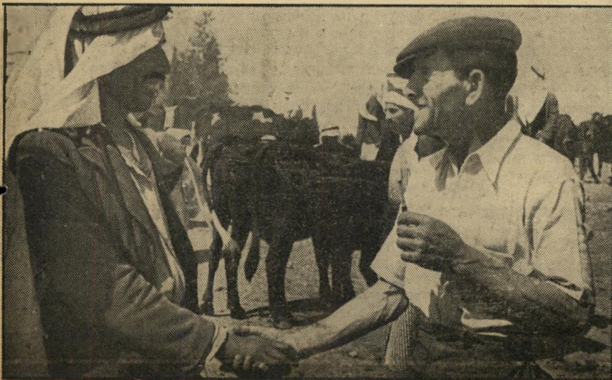
פגישה איכרים עברי וערבי

ח מדי החישובות ופיקוח מדי ריכוז בערים מדי בנבולות מדי מתווכים ומשרתים מדי עובדים יצרנים מדי רדיפה אחרי נחות רוחים עשיר מדי פריק עבודה וזמה חלוצית מדי פילוגים ומריבות ת מדי מאבק משותף ואחריות כללית מדי תביעות מהמדינה ת מדי תביעה מנעמו.