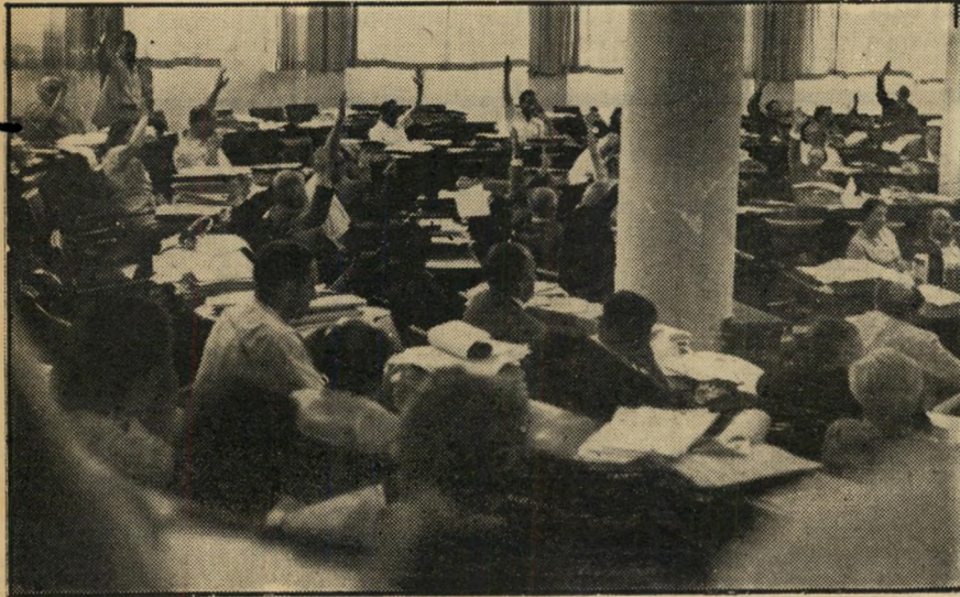
הכנסת השלישית. על כל מפלגותיה

כך : א/40, צ/20. לא : ב/8, גד/8, ח/4, מ/8, ס/8, פ/8, ק/8, ת/8.