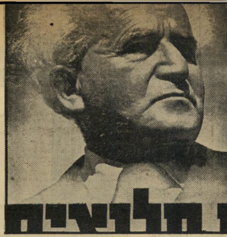
מורעת-בחירות של מפא"י

ח מדי החישובות ופיקוח מדי ריכוז בערים מדי בנבולות מדי מתווכים ומשרתים מדי עובדים יצרנים מדי רדיפה אחרי נחות רוחים עשיר מדי פריק עבודה וזמה חלוצית מדי פילוגים ומריבות ת מדי מאבק משותף ואחריות כללית מדי תביעות מהמדינה ת מדי תביעה מנעמו.