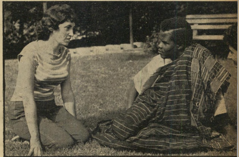
סמינר לקואופרציה, בתליאביב

כך : ס/60. לא : א/8, ב/8, גד/8, ח/2, מ/8, פ/8, צ/8, ק/2, ת/8.