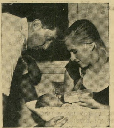
מטמור 1, 2, 3

ספרדים אין זה נכון שרק יהודים לארי סליב התעוררו לפתע מפלגנות. "הלבנות" לבעיית ערות המזרח, והכניסו מועמדים מכני ערות אלה, במקומות בטוחים לכנסת (העולם הזה 1152). הנה, חבר הכנסת חיים יהודה, למשל, היה ח"כ מפ"ם גם בכנסת השלושית, כשהודי בן-הרוש עוד עבר כנער שליח כחברת החשמל... אליהו גורדי, תל-אביב ... יש שני סוגים של ספרדים: אלה הכואבים את כאב בני ערדם בהיותם שותי פיהם לנורל, ואלה המסתדרים ומבטשים טובת הנאה בהיותם ספרדים כסבלות אחי יהם! מוריס חיון, בתים בקיצור: ספרדים. אתם חושבים שאחד מכל הח"כים החדשים, שכת היטבתם לכנות "בני הרש", יגיד שלום לדודי בן-הרוש כשיפגשוהו במזון הכנסת? הוא יתנהג כאילו שזה מתחת לבי בורו, אבל מבחינה פסיכו-אנליטית אפשר להסביר זאת בכך שהם מפתחים רגשי שנאה, כלפי האדם שהם חייבים לו תורה... תהליך פסיכי מקובל. מרים שור, חיפה