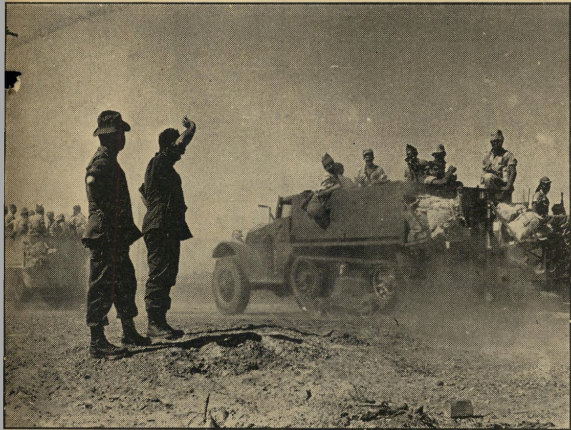
יהדות צה"ל במיבצע קרש

כך : א/15, ח/30, תו/15. לא : מ/18, ס/10, פ/10, ק/22.