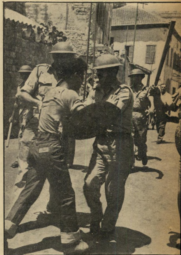
קרבי-רחוב בודי סליב

כך : מ/25, ס/5, פ/5, ק/25. לא : א/15, ב/5, גד/5, ח/15, צ/5, ת/15.