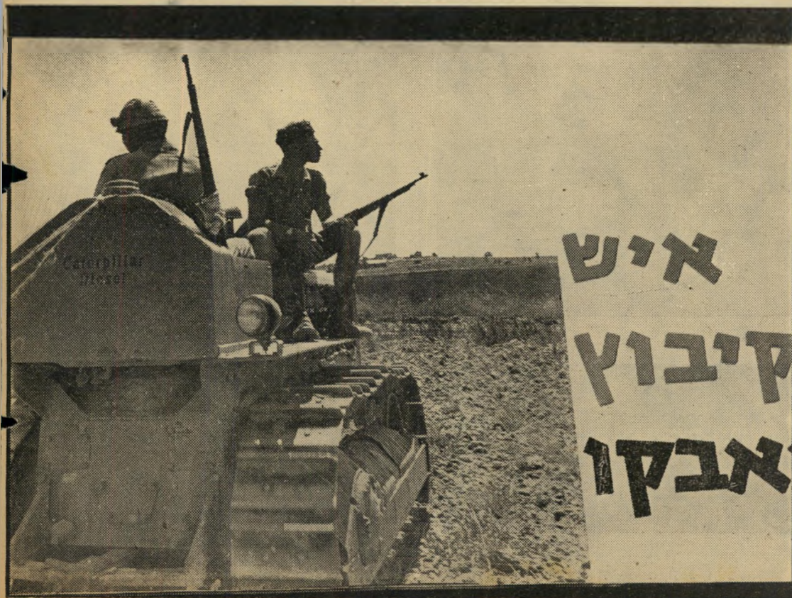
כרות-תעמולה בתערוכת הקיבוצים תשי"ח

כך : א/10, ב/6, גד/2, מ/20, פ/2, ת/20. לא : ח/20, צ/20, ק/20.