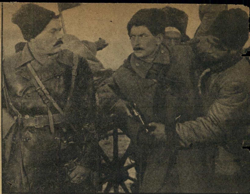
3. הדון השקט (ברית-המועצות)