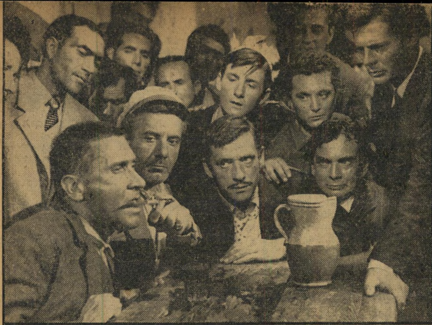
4. החוק (צרפטיה)