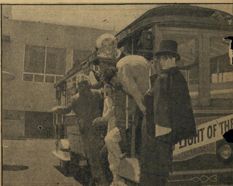
3. הזבוב (ארצות הברית)