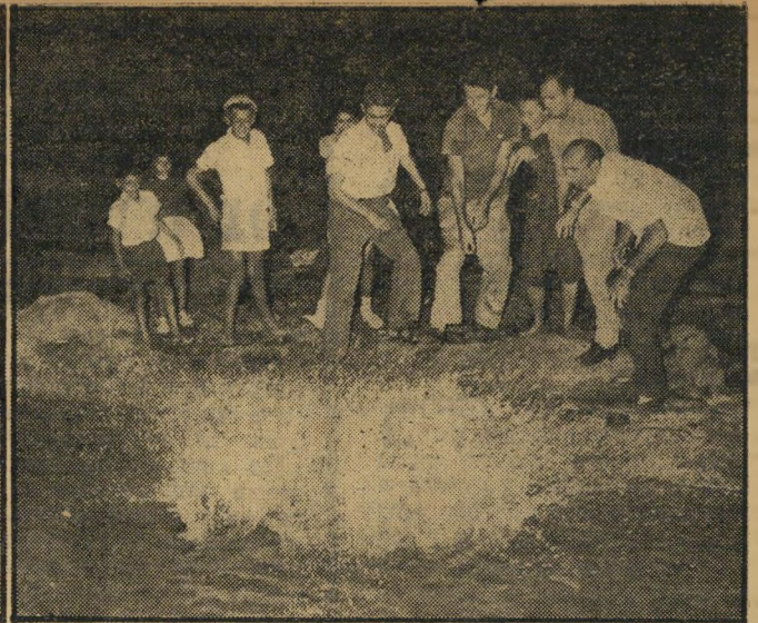
חתן אביבי נזרק לים (ימין) ומושה מן הים את כלתו סוף רטוב, הכל טוב

המים, משה אותה כמו ידיו ונשא אותה רטובה אל ביתם המשותף החדש . . . א. נ. פראה , המפקח הכללי על התעבורה בדרכים בגאנה, ערך השבוע סיור במחקני אגו, כדי "להעביר את אגו אלינו", כפי שהסביר. בין השאר קיבל הסבר על מבנהו של אגף הפנים של הקואופרטיב לתחבורה, המטפל בכל בעיות החבר כולל בעיות ה- משפחה שלו. משמע פראה כי הנהלת התנועה דואגת שכל נהג יוחזר לביתו עם תום משמרת-הלילה שלו, חיך האורח: "זה בורר, כדי שאגף הפנים לא יצטרך אחרי- כך לספל בבעיות המשפחתיות שלו".