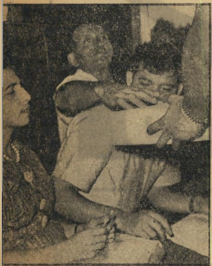
הנוסעים מצביעים אחריו...