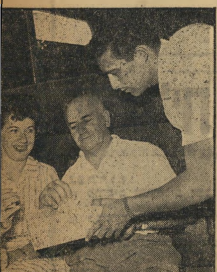
הגבר מקריים את האשה...