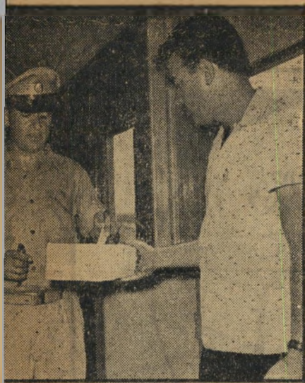
הכרמל שם פתק ראשון...

אנשי חולית-החשק של הקלפי ה' נסיונית לא הסתפקו השבוע בשתי ה' קלפיות ברכבת, החליטו למרות הנסיון ה' מר ביום רביעי, להציב קלפי נוספת בעיר