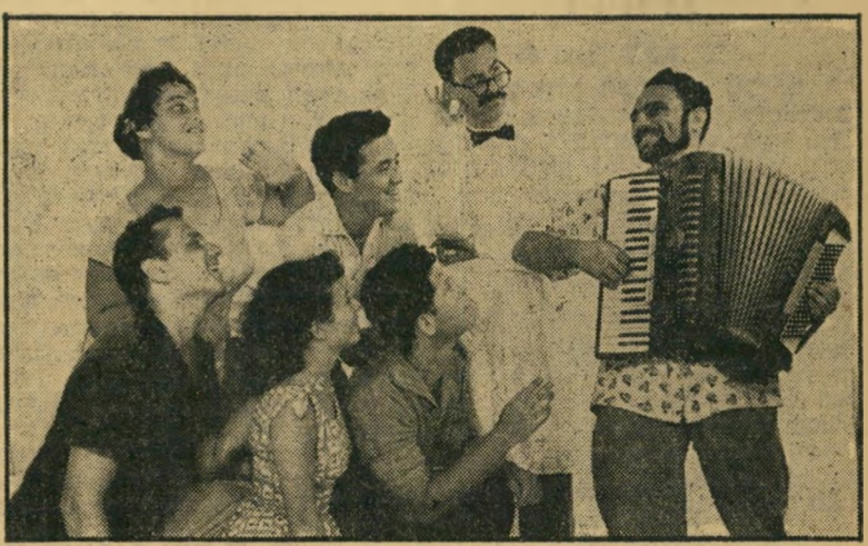
להקת "צחוק וחצי"*