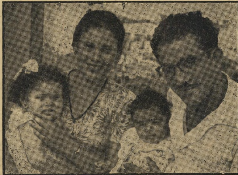
מוגלה מחמוד סרוגי' כחוג משפחתו הקצין אמר: "מה אתה רוצה מממשלת דיכוי?"

קבע המצע, אחרי שחזר על הכרזת נאמי' גותם של ערביי ישראל לאומה הערבית הגדו' לה: ערביי ישראל יהו גשר של שלום בין ישראל ומדינות ערב, אחרי שישראל תחזור את זכויותיהם ותביע את נכונותה לתת את בעיית הפליטים הערביים. הנוכחים לא יכלו, כמובן, לדעת כי בזאת חתמו בניו יתיהם על פקודת מעצרים והגלייתם. הם ברע שיקיבלו מצע העצום לרכוש את לבו של הציבור העברי המתקדם והאחראי, הם הפכו סכנה חמורה לעצם קיום הממשל הצבאי."