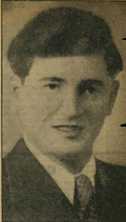
ספר פרידמן ... ומכאן