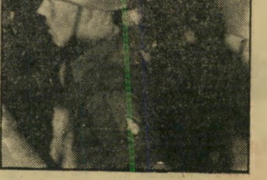
חילוי צה"ל במיצעך

אחר בדיקת פה-פה נוכחתי לדעת כי נוער ביה"ר, במידה והיה נוכח באסיפת העם ב"מנרבי", לא גרם לשום הפרעות, לא במאורגן ולא ביחידים. מניעה בחופשי הדבור וההבעת דעה בפומבי ובציבור, מן געת בעקרונות הדרר הבית"רי. על כן כל