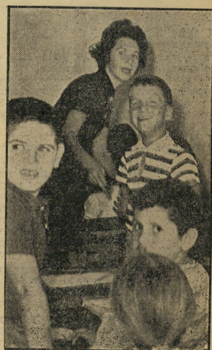
מורה הרפו והכיתה במוסך נגד ילדים בחנות, התוח במשטרת