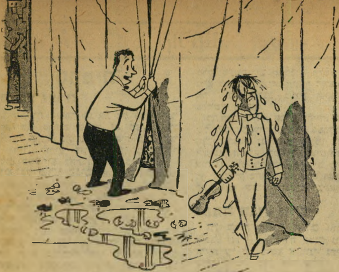
הקהל קורא לך שוב!"