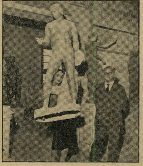
עם האולפנאי ד"ר אוגוסטיני, מנהל הסגל של צינה ציטה, מאפשר ליהודית להיכח במשקלם הפעוט של הפסלים, העשויים מחומר פלאסטי.