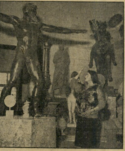
עם ציאוס במחסן הפסלים של צ"י, נה ציטה עונדת יהודית שריון פלדה, מצדיעה לפסלו של ציאוס. במחסנים אלה מרוכז כל היצוד להסרת הסרטים האיטלקיים.

האם המועמדת היתה או הנה חברה בתנועת-נוער, תנועה קיבוצית, אירגון ספורט, להקה אמנותית או כל אגוד אחר?