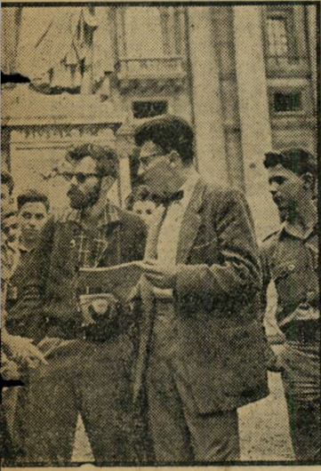
עם הגדנ"עיס בקריית-הותיק, שורה התעניינות בזה לזה על חיותיהם מביקורם הראש