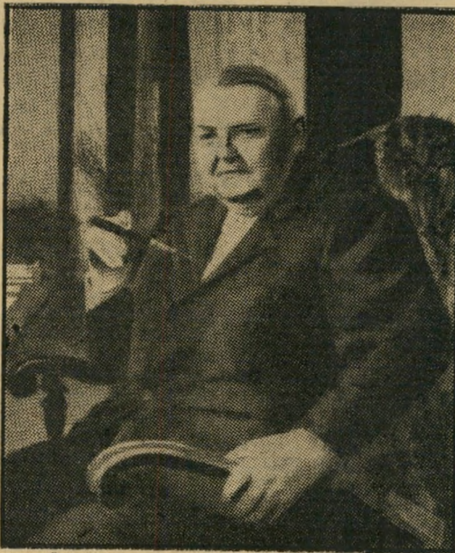
ראש-הממשלה-המיועד ארהארט לחפלה, שוחד

גיבור הפרשה לא היה שטראק, אלא יואכים הרצלט, היועץ לסחר-חוץ במשרד-המסחר והתעשייה. הרצלט ניהל