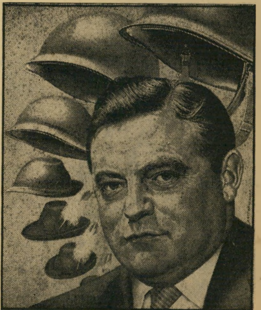
שר-הבטחון שטראוס לגרמניה, שטרוריה

● הסברה כאילו יהיה הנשיא אדנאר מעין דה-גול גרמני, שינהל את המדיניות מסע הנשיא, מן-פרכת מיוחדת. בגרמניה אין אדנאר פופולארי ביותר, מאחר שהוא מייצג (כמו בן גוריון בישראל) קו מלחמתי נוקשה. בגרמניה גם אין כל נטיה להעניק לנשיא סמכויות-חירום דיקטטוריות. מן הסוג שניתנו לדה-גול כאשר איימה מלחמת-אזרחים ותבוסה צבאית על צרפת.