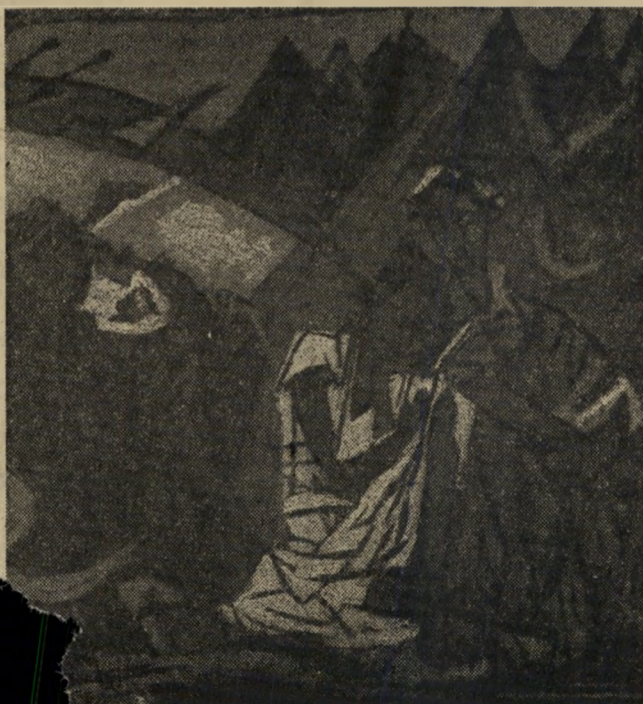
..אלוהים ודמויות במעבה"