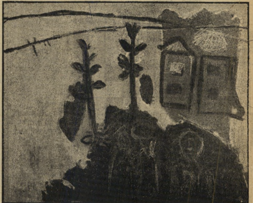
..בית אדום במאה שערים"