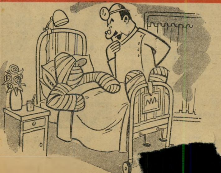
ף הזה מדאיג אותי