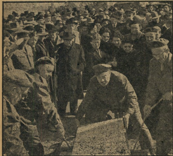
בבית-חשברות על הר הרצל. אנטי חברא קדישא של חצבא, מורידיים את חארון לבור.