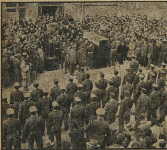
מול בנין הכנסת. ארונו של יוסף שפרינצק מוצב על במה, מוקף אנשי משמר הכנסת.