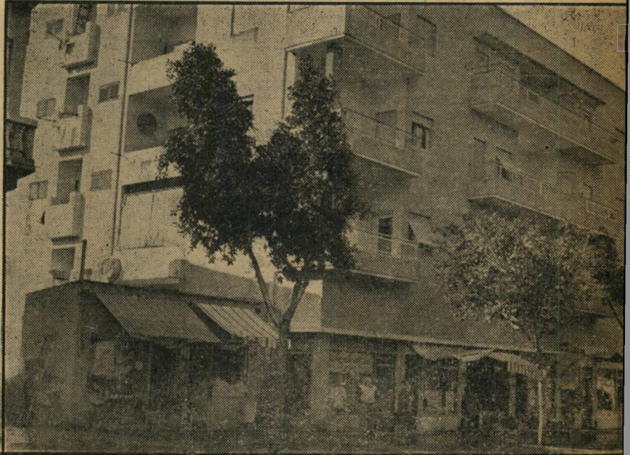
רכשה מנהלת בתי הבושת דירת בת חדר, באחד הבתים הגדולים במרכז. את עסקיה ניהלה באמצעות חזנות טלפונית מצד גברים מכובדים ועשירים.