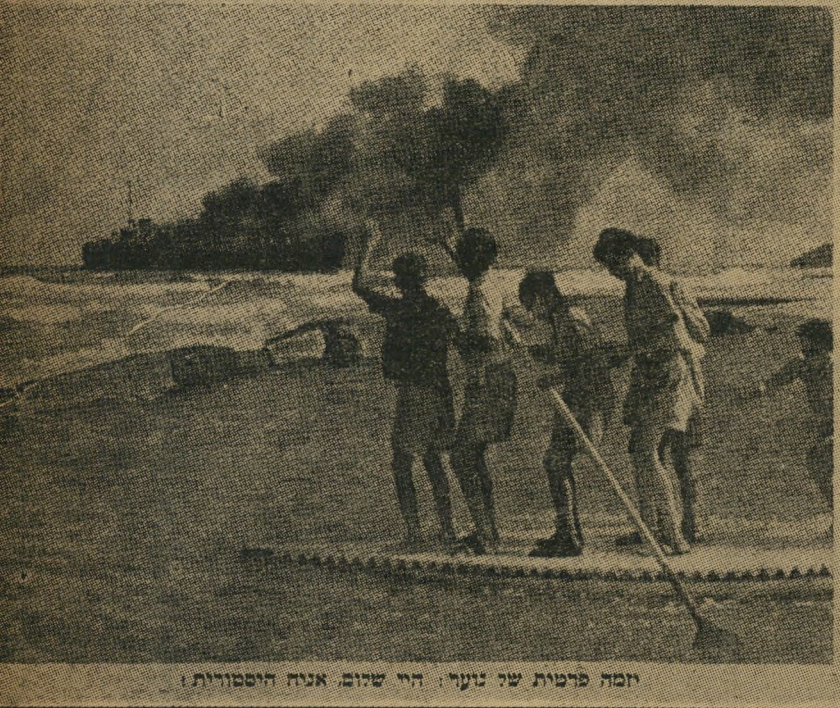
זמנה פרטית של נערי. היו שזמם. אניה היסטורית!

מות אלטלנה שלושה צילומים אלה הופיעו בעולם הזה, בשבוע בו הועלתה אלטלנה באש, מול חוף תל-אביב. השלד החרון של אניית-הנשק נשאר עומד על שרטון זמן רב, עד שנגרר מסקומו וסובע הרחק בלב-ים.