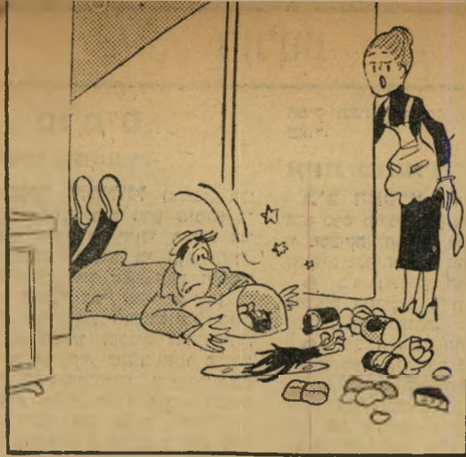
"שכחת את האיטריות!!!"

סוף שחור אורח חשוב בא מאפריקה לבקר במדינה. במטוס הגישה לו הדיילת את תפריט הארוחות. הנוסע העיף מבט במעדנים המוצעים לו ועיקם את האף: "אולי יש משהו יותר טעים?" הדיילת לא היססה הרבה, הגישה לו את רשימת הנוסעים.