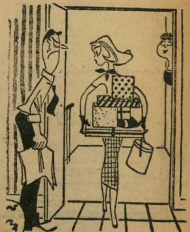
"אל תדאג, הן ריקות! זה רק שבביל לשמור על ה- פרסטיז'ה בעיני השכנים."