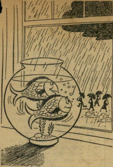
"מזני אור נפלא היום."

תחת אש את הבדיחה הבאה, שאיננה כליכך בדיחה, שלח אלי חבר משך חולתא בגליל, על שיחה במיקלט, בשעת ההפגזה האחרונה: "אמא, למה היא בוכה?" — היא איננה רגילה למקלט ואף פעם לא שמעה הפגזה. — "אמא, אותך כבר לימדו בחוץ-לארץ לסבול?"