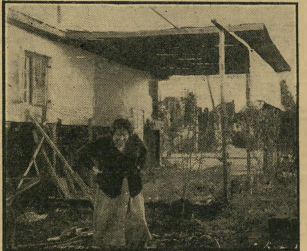
הדבוק לבית מכמה פחים על עמודי עץ, שימש עילה למשפט. לדברי פיין: בגלל התנגדותו המוצהרת לראש המועצה.