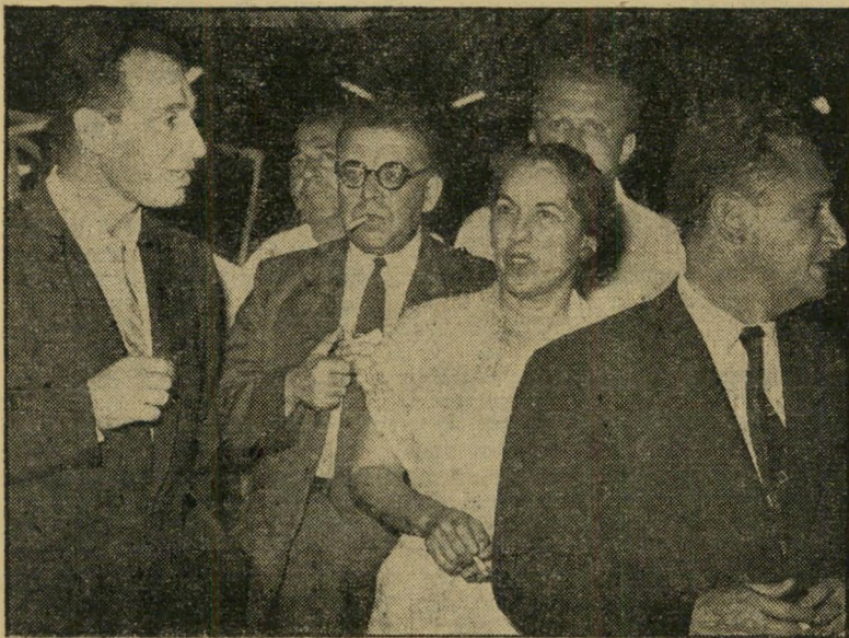
עסקן פרס (שמאל) וידידים ** פשוט מאוד, עוד נשק

בבקבוקים שנשאו על מכסהים המלה "מהד' רין". רבני אגודת ישראל, מצידם, פירסמו הודעה, כי רק החלב המוחתם "מהדרין"