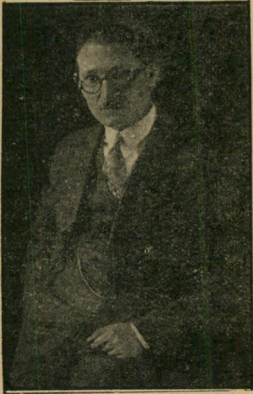
רב צבי אריה לדרברג כשהאב סיפר על בנו —

לפני שבועות מספר, כאשר נודעו תוצ' ארת חלוקת פרסי נובל למדע, יכול היה מדען ישראלי להיות אחד ממקבלי הפרס. אלא שישראל החמיצה הודמנות זו. ההודמנות החמצה עוד לפני כארבעים שנה, כאשר עילוי צעיר יליד יפו בן 13 עזב את הארץ, נסע ללמוד תורה בארצות-הברית. צבי אריה לדרברג, בן למשפחת סוחרים ארץ-ישראליים מטועפת, למד עד גיל 13 בישיבת הרב קוק בירושלים. בגיל זה נסע ללמוד בישיבה אמריקאית. בן 18 כבר הוסמך להיות רב בפילדלפיה. הוא חשב לחזור ארצה, אלא שהוצעה לו משרת רב בפילדלפיה, והאיש נשאר שם. כך איבדה ישראל איש מדע שזכה בפרס