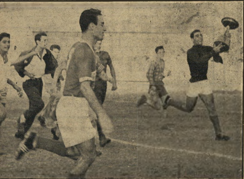
שוער פורטל נושא את גביע העשור בגמר המשחק ביפו, סלטות באויר