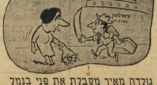
גולדה מאיר מקבלת את פני בנמל

"אינך יודע שהצבא הישראלי עבר את הגבול ונמצא עכשיו 15 קילומטרים מאיסמעיליה?"