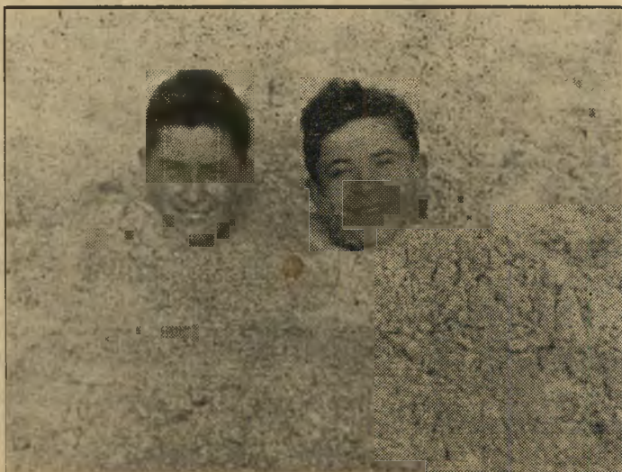
שני ראשים בחול — צילום של משה פרידמן, כפריאתא.

מעשה במקום מסויים שמשם נמלטו כבר כולם. עבר חודש ימים, והשר? — הוי תמימים, נאלם, אבל לא נעלם!