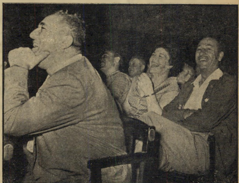
צופי סמבטיון נהנים הנאה מרובה משלל הסקאטשים, הפזמונים, החכמות והחתחכמויות המוטה בהם בתכנית סמבטיון הרביעית.