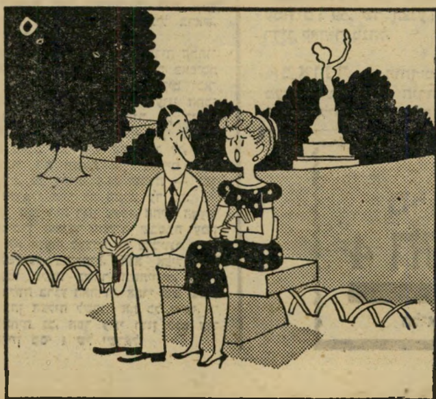
"אם אני לא, אני יודעת שתהיה אומלל. ואם אני כן, כוודאי תהיה אומלל... קשה לי להחליט!"

"דואר צבאי 1005 — רוקד" (הארץ) מרדכי דן, תל־אביב לצילי תזמורת צה"ל. נתערער שחי משקלו הנשרי (ידידות אחרונות) אורי שיקה, חיפה דמיונו המריא לשחקים. המקרע המזעזע אירע. (מעריב) יהושע פירסט, ירושלים ממשו קורע לב. מאז לא נוגעו עקבותיו. (ידיעות אחרונות) גירה מן, חיפה רצונך לנעת? בבקשה.