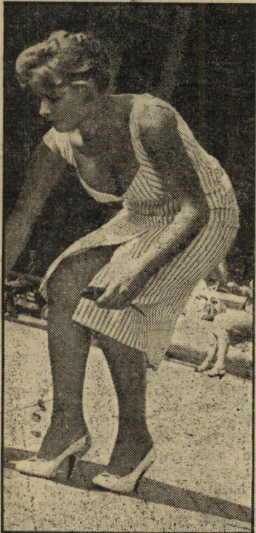
אלאסיו ב"עניה אבל יפה" יפה ולא עניה

השבוע נודע על הקמת מועדון קולנוע ששי במספר, תוך שיתוף פעולה בין קולנוע פאריז בתל-אביב למערכת אמנות ה-קולנוע. החידוש שבו: הוא יציג סרטים שלא