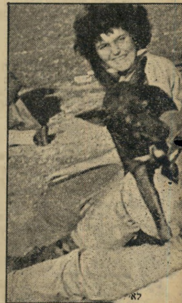
לאסי התגלתה חטיפת המשטרה הראשונה בחג סוכות, לנלות מחבואי סכביה הצעיר.

ה חלק החינוכי של הגיימקאנה מתחיל ברגע בו עולים השוטרים על המגרש.