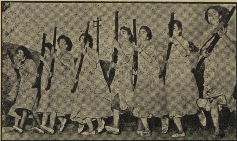
מתנדבות המשמר הלאומי העיראקי בפעולה