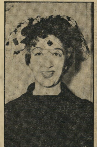
דוגמנית קליין הלכה האם אחר הבת

צורתה הנאה ומקצועה המיוחד הכריחו את חנה להמצא תמיד בחברת גברים ש"