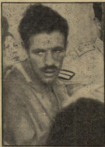
חרש-אידם דויד לא אנט

להכריל רשמית בין יהודים ועברים הציע עורך העולם הזה (1084) במאמרו "גוי עברי", בו דרש לקבוע כי "יהודי" הוא אדם השייך לדת היהודית, ואילו "עברי" הוא אדם השייך לאומה העברית. השבוע פנה נציג האפיפיור בארץ-ישראל, מונסיניור אל-ברטו גורי, במכתב רשמי בשם הכנסיה הקתולית לראש-הממשלה, דרש את אותה הדרישה עצמה, הציע אף-הוא להגדיר כחוק כי "יהודי" יהיה מעתה מונח דתי בלבד, בעוד ש"עברי" יהיה מונח לאומי. דו"ח ראשון על הקרע המתרחב בצמרת העיראקית פורסם לפני חודש בהעולם הזה (1091) מפי אישיות זרה, שערכה סיור מקיף במרחב, נפגשה עם רוב המנהיגים החשובים. בין השאר כתב האיש: "השלטון בי-עיראק מחולק לשתים קבוצות. בצד אחד עומדים הקצינים הצעירים, כולם ערבים, כי הנהגת עבד אל-סלאם עארף... עבד אל-כרים קאסם עומד באמצע, קרוב יותר למדי נאים המתונים". ארבעה ימים אחרי שהעורר לס הזה (1093) בחר בקאסם כבאיש-המרחב של השנה והדגיש שוב את ההבדל בינו לבין עארף, הודיעה ממשלת עיראק כי עארף הודח מתפקידו כסגן הרמטכ"ל... הנאשמים במנהיגות מחתרת טרוריסטית, שמטרתה למגר בכוח את המשטר הנוכחי במדינה, ד"ר ישראל ("אלדד") שייב