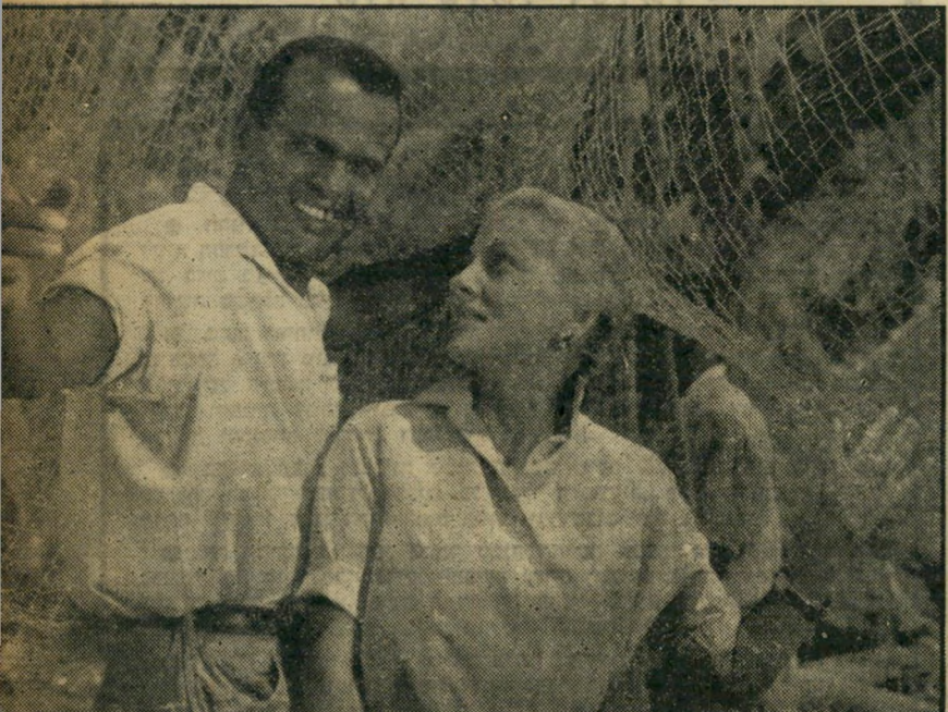
אי בשמש (ארצות הברית)