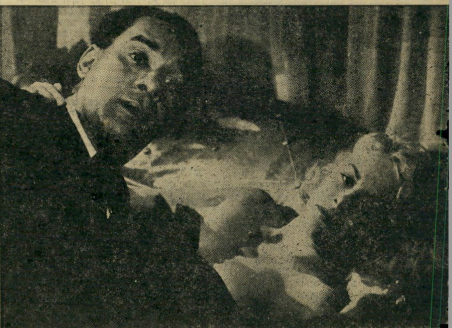
יליד הארץ (ארצות הברית)