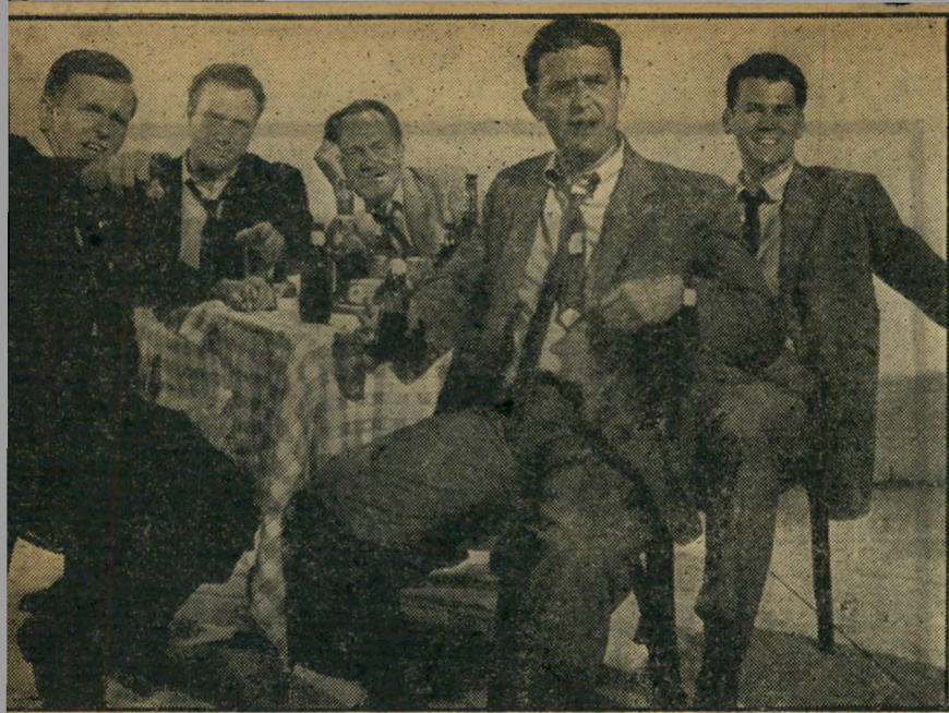
מסיבת הרווקים (ארצות הברית)