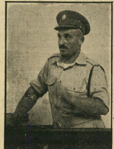
שכטר האיש שיצא לנגוב תירס כדי להביאו לקצין התורן, ולקח יחד אתו את מפתח מחסן הנשק.