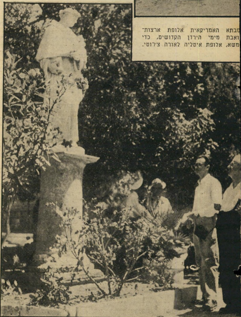
במנזר הפרנציסקני בנצרת עומדים ששה מאלופי התנ"ך, שערכו טיור במשך עשרה ימים בארץ התנ"ך. הביקור בנצרת, על כנסייתה ומקומותיה הקדושים, השאיר עליהם אדוקים, שהתלהבו כשזיזונות התנ"ך והברית-החדשה הפכו למציאותיים לנגד עיניהם.