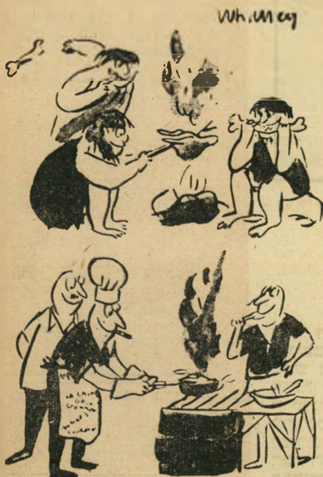
מאז ועד עתה?

אשתו שמעולם לא ראתה בכעורה, לא יכלה להבין את דרישתה. אבל בקשתו האחרונה של המת קדושה היתה לה. ולכן, על קברו היא חרתה: "פה מונח בעלי, שבמשך 35 שנים של נשואים לא בגד בי, אפילו פעם אחת!" ומאז, כל התל-אביבים שעוברים, וקוראים את הכתוב על המצבה, מפליטים בתדהמה: "הרי זה לא יאומן!"