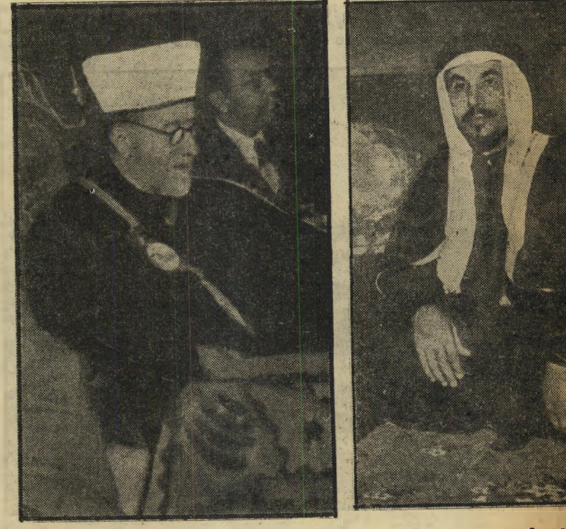
אל-כילאני רשיד עלי, המשפטן שהועמד בראש הממשלה העיראקית, בעזרת הצבא. אחרי שמשטרן חוסל, נמלט אל-כילאני לסעודיה (מימין) שעה שבן-בריתו, המופתי של ירושלים לשעבר (משמאל) חיפש מקלט בגרמניה הנאצית.

שני נצחונות היו לאימפריה הבריטית בקרב מדינות ערב, בשנים 1941-1942. האחד היה נגד המלך פארוק, כאשר הקיפו טאנקים בריטיים את ארמונו בקהיר, אילצוהו לפטר את ראש ממשלתו ולמנות במקומו מדינאי אהוד יותר על האנגלים. מעלבון צור רב זה, שפגע עד מעמקי נפשם בקצינים הצעירים של הצבא המצרי חסר-הישע, צמחו הקצינים החופשיים של גמאל עבד אל-נאצר, שנועדו לשים קץ לשלטון הבריטי במצרים. הנצחון השני היה נגד הממשלה הפרו-נאצית של רשיד עלי אל-כילאני בעיראק. שלושה מבין ארבעת הקולונלים — "המרוכב וההוב" — אשר תיכננו את ההפיכה למען רשיד עלי נתלו; אך נצחון הבריטים לא היה מכת-מוח לקצינים הלאומנים. עתה מסתבר, כי שימש אך מוקד להתנגשות לאר-מנית נוספת, אשר הביאה לפני שבוע לקץ ההשפעה המערבית בעיראק.