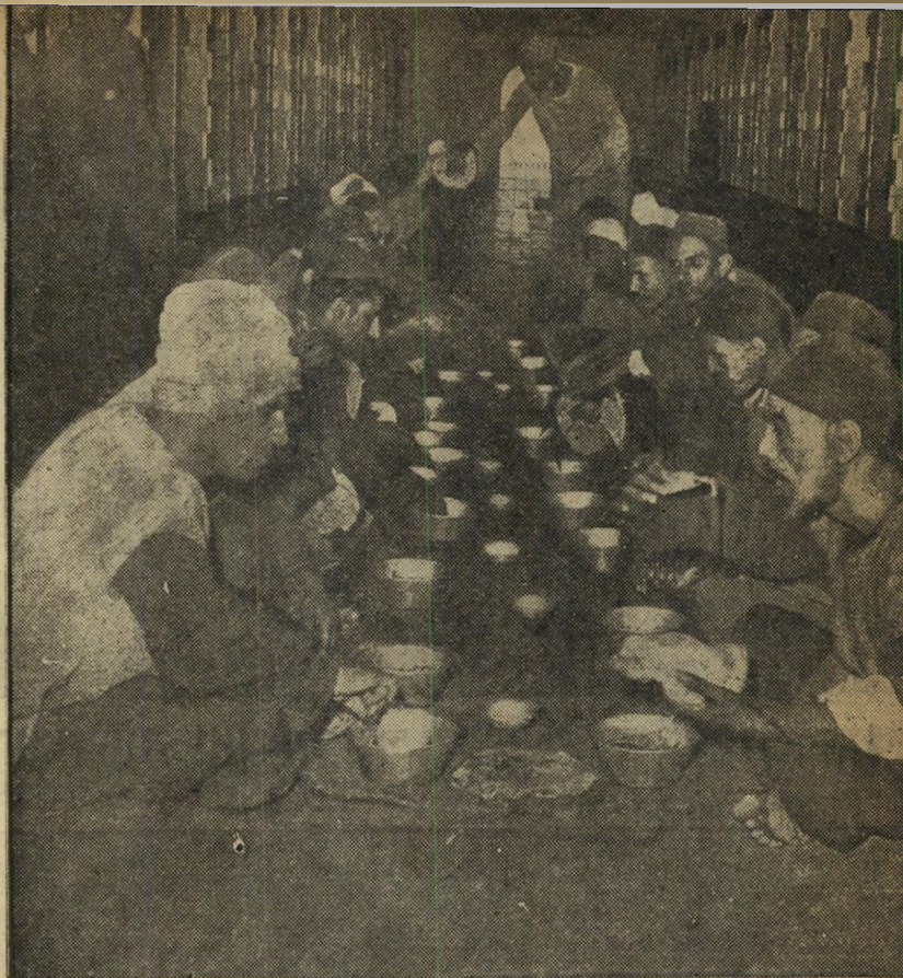
האסירים ששחררו אחד המעשים הראשונים של שליטי עיראק החדשים היה לשחרר מאות אסירים פוליטיים מבתי הסוהר. רובם הוכנסו שמה על ידי נורי אל-סעיד, חברי המפלגה הקומוניסטית.