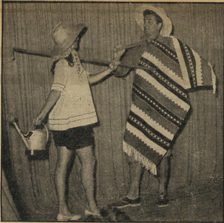
„אמנות הלוצית“ של רביעיית מועדון התיאטרון - תן תן נוי -

טים שמדמו לנו כעצם בגרון. מנה שלישית: דג פילה ברוטב תפוזים. את הדג יש לטגן לזכר החמסינים ואת התפוזים יש לסחוט לזכר המיסים שסוחטים מאיתנו עד היום הזה. מנה אחרונה: עוגת העצמאות והעשור ממולאת בפירות וסמלים. הרכב העונה: שתי כוסות בורגול לזכר הבורגול, שתי כפות שמן זית, סמל הנאומים בכנסת. כף מיט לזכר המחסור במים ו' מעט מלח לזכר הדמעות. לערבב וללוש במערבל בטון, זכר לבנין הארץ, ולשים הצידה למשך שתיים לזכר כל מה ששמו הצידה למשך יותר משתיים. להוסיף תמי ריס, לזכר כיבוש הנגב, תאנים לזכר בנות ישראל הצנועות. להכניס לתנור ולמרוח בלבניה מלמעלה. לקשט בפרורי לחם ולהי גיש לתרנגולות ולאוזנים.